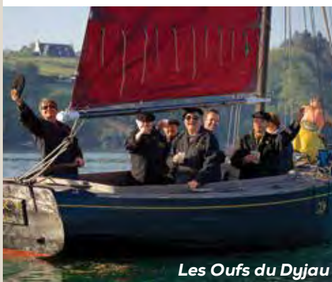
Les Oufs du Dyjau

Réservations : office de tourisme, le Chaland qui passe, le Neptune et l'Atelier. Attention, nombre de places limité !