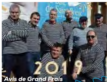
Avis de Grand Frais

23h15 : Red Cardell, rock et rock celtique