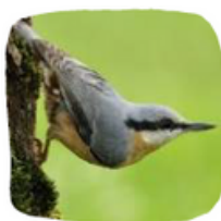
La Sittelle torchepot