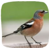
Le Pinson des arbres