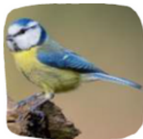
La Mésange bleue