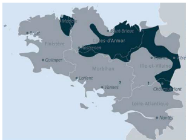
Répartition du Muscardin en Bretagne

Etant très difficile à observer, le meilleur moyen de savoir si l'espèce est présente, c'est de trouver l'un de ses repas préférés : les noisettes !