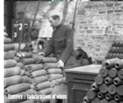
Tanvez : fabrication d'obus