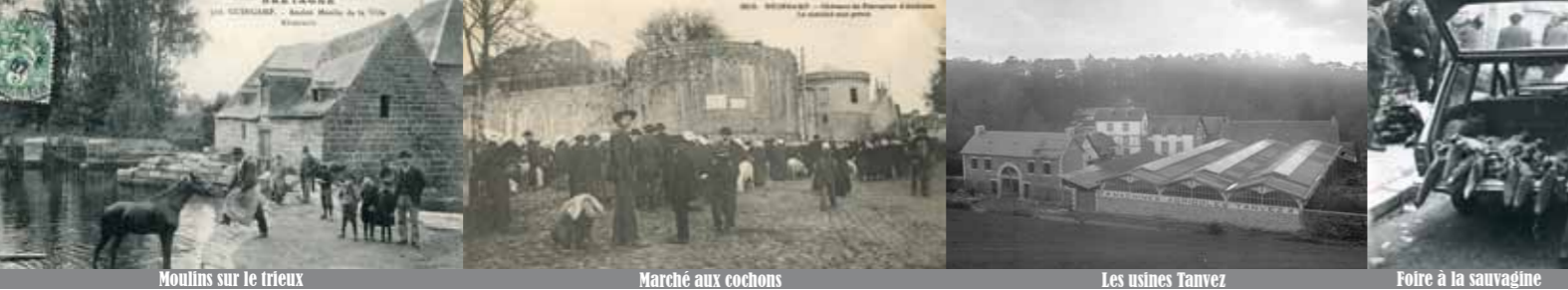
Moulins sur le trieux