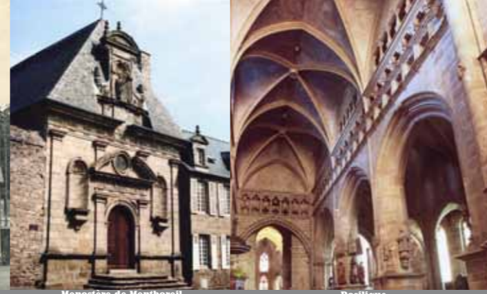
Monastère de Montbareil