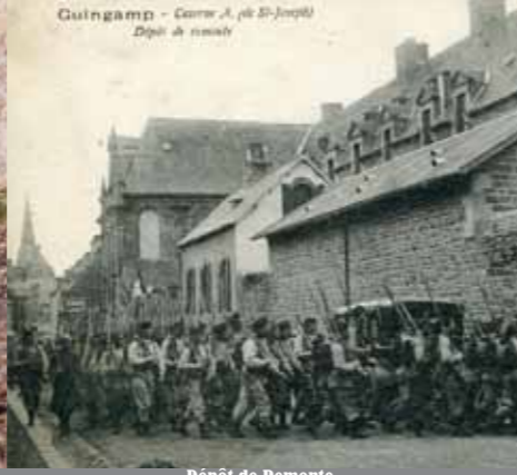
Dépôt de Remonte