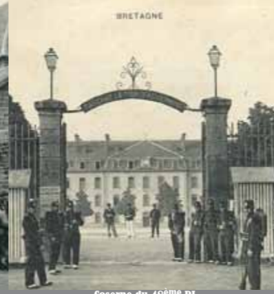
Caserne du 48 ème RI