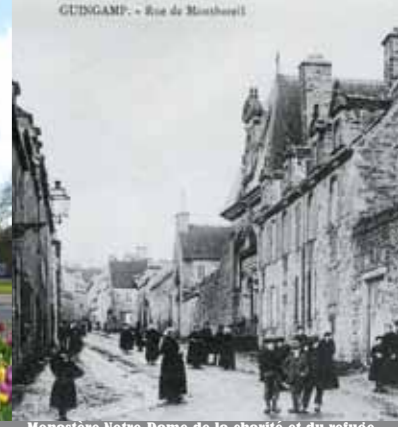
Monastère des Augustines Hospitalières