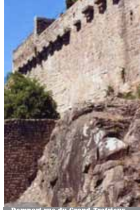
Rempart rue du Grand-Trotieux

Au XII e , vers 1123, la puissante famille des Penthièvre construit un second château. La motte est rasée, les fossés comblés et une enceinte polygonale en pierre est édiflée, dans un style inconnu en Bretagne mais que l'on retrouve en Angleterre et en Normandie. Cette période marque le développement important de la ville qualifiée de chef-lieu de comté en 1151.