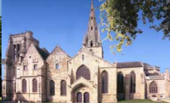
Basilique (façade sud)