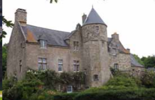
Abbaye de Sainte-Croix