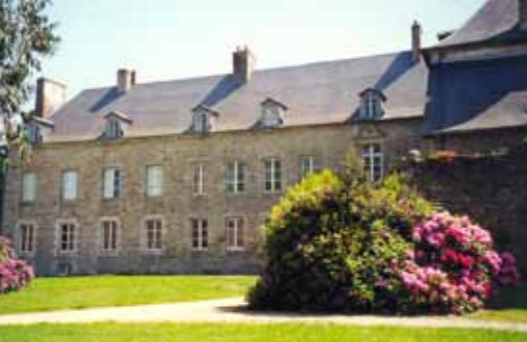
Le Château des Salles