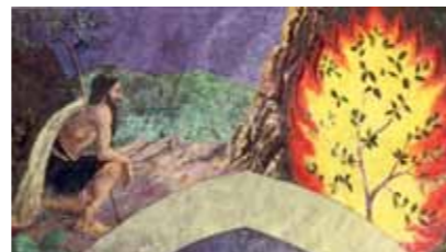
Tableau de Paul Sérusier

« Le buisson ardent, l'Annonciation et l'Adoration des bergers et des mages. » Paul Sérusier (1864-1927) est un peintre français post-impressionniste, associé au mouvement des Nabis. Peints en 1904 et 1905, ces tableaux, destinés à l'Eglise de Chateauneuf-du-Faou furent refusés par le Curé. La femme du peintre en fit don à la ville de Guingamp dans le cadre d'un projet non abouti de musée breton.