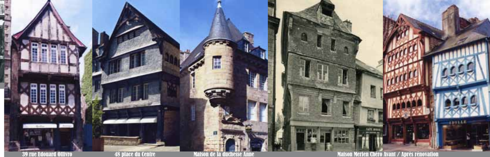
39 rue Edouard Ollivro