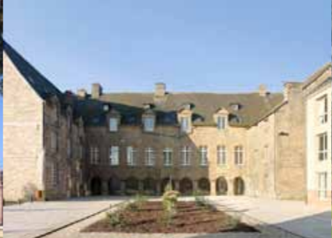
Monastère des Ursulines