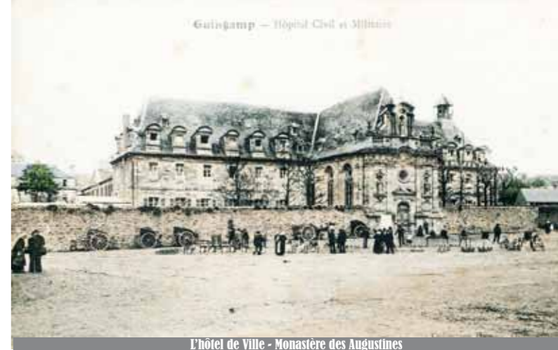
L'hôtel de Ville - Monastère des Augustines

Ce manoir se trouvait autrefois en pleine campagne, sur la commune de Plouisy et a été englobé dans l'urbanisation du quartier qui porte son nom dans les années 60. Rebâti au XVII e siècle, ce manoir, d'une belle architecture classique, était composé d'un grand corps de logis, avec deux pavillons, d'une grande cour avec un magnifique portail d'époque Henri IV. La propriété était entourée d'un vaste jardin, oeuvre d'André Le Nôtre, jardinier du Roi.