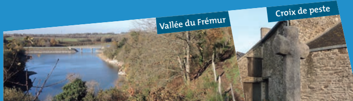
Vallée du Frémur