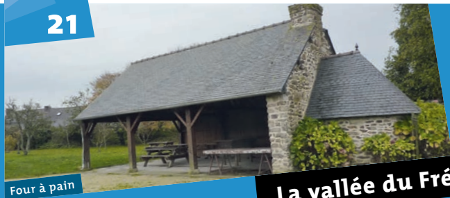
Four à pain