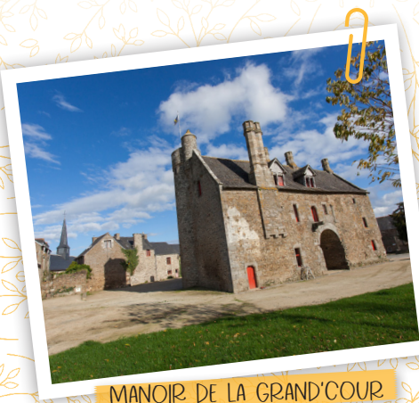
MANOIR DE LA GRAND'COUR