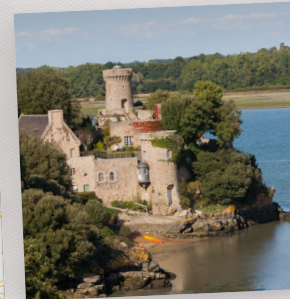
CHÂTEAU DE PÉHOU

Ancienne forteresse des Trémereuc, ce château privé domine la Rance depuis longtemps déjà : les vikings au IX e siècle, puis les Anglais au XIV e , purent le voir lorsqu'ils débarquèrent sur nos côtes. Plus tard, il fut la propriété du musicien compositeur Henri Kowalski, élève de Chopin.