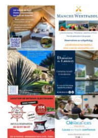
EXTRAIT E-BROCHURE 2024

Communication en amont du séjour des visiteurs (les guides des hébergements sont essentiellement consultés en ligne ou envoyés par mail sur demande, lorsque les touristes préparent leur venue)