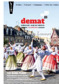
GUIDE LOISIRS & SAVEURS 2024

Distribution : équipements de loisirs et culturels, restaurants, commerces, hébergements, mairies, Offices de Tourisme du département, envoi par courrier, consultation en ligne.