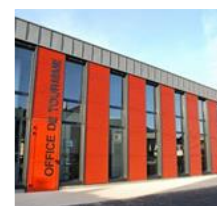
EXEMPLE AVEC LES VITRINES DE PAIMPOL

⚠ Vous nous apportez vos produits à exposer en vitrine (sur rendez-vous) et gérez le remplacement des produits si nécessaire (altération avec le soleil etc.)