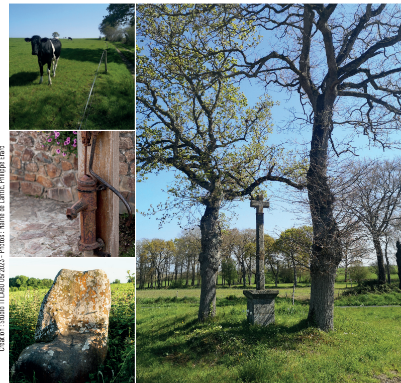
Création : Studio TLLABO 05/2023

Distance : 7,3 km • Durée : 1h45 Difficulté : moyenne à difficile