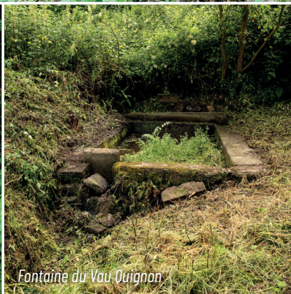
Fontaine du Vau Quignon