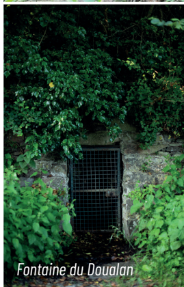
Fontaine du Doualan