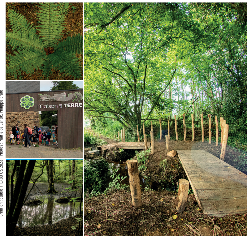
Création : Studio TLLABO 05/2023 - Photos : Mairie de Lantic, Philippe Erard

Distance : 9 km • Durée : 2h Difficulté : très facile