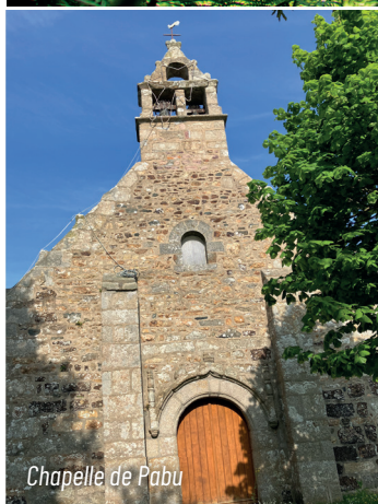
Chapelle de Pabu