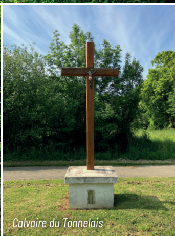
Calvaire du Tonnelais