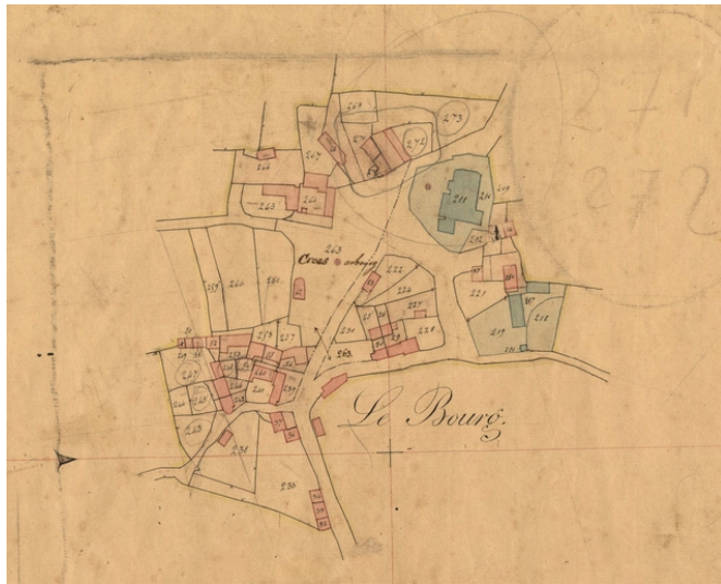
Le bourg de Plougras en 1834. Extrait du cadastre ancien

Au début du 16 ème siècle, les seigneurs du Ménez se déclarent fondateurs et uniques prééminenciers de l'église paroissiale Saint-Pierre. Leurs armes sont apposées en alliance avec celles d'autres familles sur l'entrait du transept nord et sur l'autel du chœur. Les terres des Ménez occupent toute la partie ouest de la paroisse de Plougras, sur un territoire d'environ 1000 hectares.