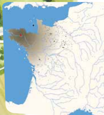
Carte de répartition des haches produites par l'atelier de Plussulien. • Atelier de Plussulien • Zone de semis dense • Moins de 10 haches connues • De 10 à 40 haches connues • Plus de 40 haches connues