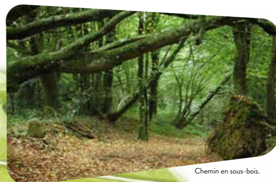
Chemin en sous-bois.