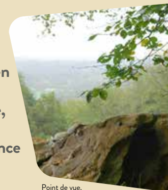
Point de vue.

Culminant à près de 310 mètres au centre d'une ligne de crêtes allant de Laniscat à Merléac, le site de Quelféneq en Plussulien est une fenêtre ouverte sur les paysages du Centre Bretagne, mais aussi sur l'histoire néolithique (1) de l'Ouest de la France et au-delà.