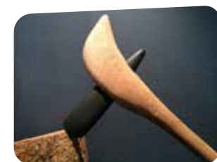
Lame de hache en pierre polie emmanchée dans un manche de bois.

Après 2 000 ans d'exploitation, les carrières de Plussulien ont été peu à peu abandonnées, supplantées par une découverte révolutionnaire qui marque le passage à un nouvel âge : l'outillage métallique, en bronze puis en fer.