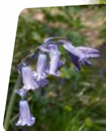
Jacynthe des bois (Hyacinthoides non-scripta).