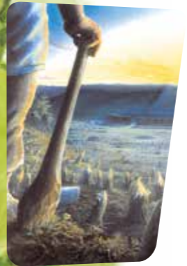
Évocation des défrichages au Néolithique.