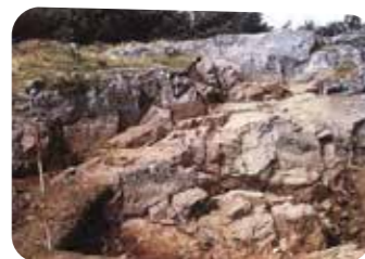
Carrières de Plussulien mises à jour lors des fouilles de 1973.

Affirmant leur emprise sur la nature, les hommes du Néolithique édifièrent d'imposantes architectures telles que des maisons collectives en terre et en bois. Aujourd'hui, les témoins les plus marquants de cette époque sont les mégalithes, dont on trouve plusieurs exemples dans les environs, indissociables du site. Ils témoignent de la sédentarisation et des croyances des populations, dont une partie a participé au développement des carrières de haches polies de Quelféne. Les mégalithes de Saint-Mayeux ; le grand menhir de Gorest à Canihuel ; les trois superbes sépultures du Liscuis à Bon Repos sur Blavet ; autant de marques laissées par nos ancêtres, qui demeurent des énigmes à résoudre !