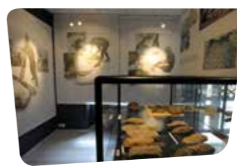
Musée de l'Archéologie.

Bretagne Centre, la commune de Plussulien et l'association les Chemins de l'Archéologie, a entrepris d'aménager un sentier balisé.