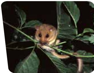
Muscardin ( Muscardinus avellanarius ).

Le site de Quelféneq présente des milieux variés, principalement prairiaux et boisés, mais également de nombreux habitats intermédiaires semi-ouverts, favorables à l'accueil des mammifères (alimentation, gîtes, refuge ou circulation). 13 espèces de chauves-souris ont été recensées sur le site, dont la Barbastelle d'Europe, menacée à l'échelle de la Bretagne, ainsi que le Muscardin, espèce emblématique, qui affectionne les lisières de bois et forêts.