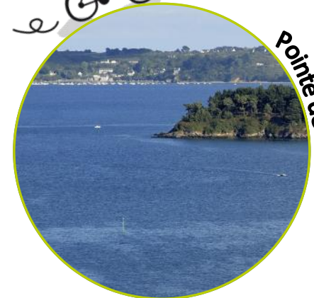
Pointe de Guilben