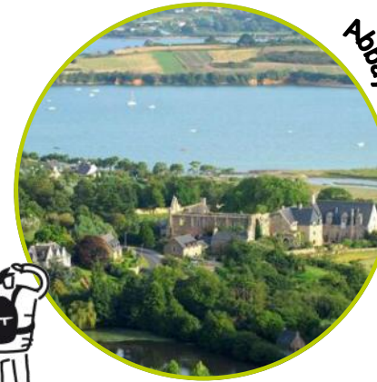
Abbaye de Beauport