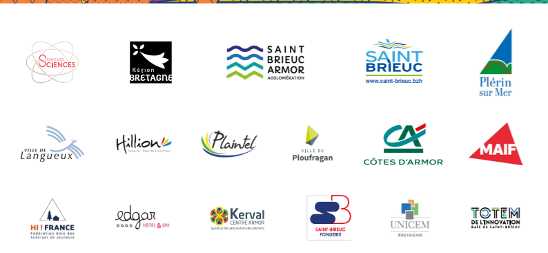
Illustration et graphisme : Mathieu Bourdeille